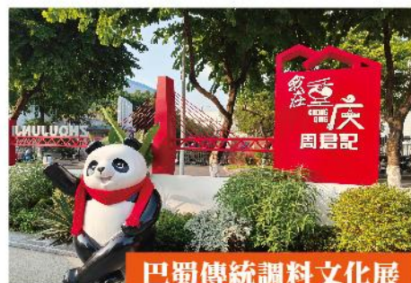
巴蜀傳統調料文化展