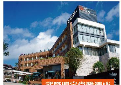
武隆明宇尚雅酒店